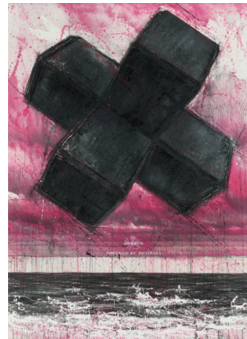
《RUNNER 2015》 259 × 194cm ミクストメディア