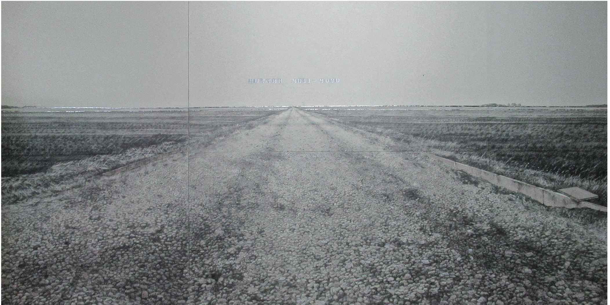
《RUNNER 希望の轍》 194 × 390cm ミクストメディア