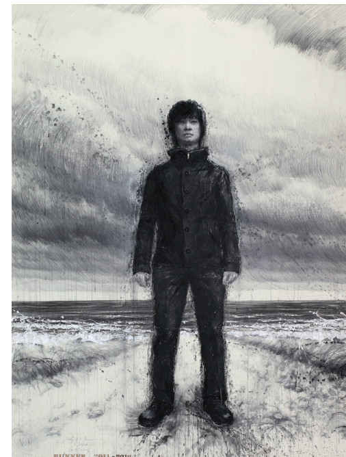
《RUNNER 青年》 259 × 194cm ミクストメディア

〒330-0803 さいたま市大宮区高鼻町1-20-1 大宮中央ビル1階 お問合せ JGS (株)ピア21 デザインワークス 担当: 服部 Phone: 048-649-3921 Fax: 048-648-5659